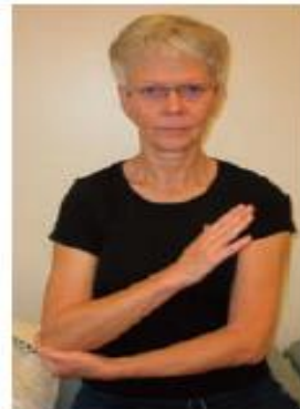
4. Drej underarmen, så håndfladen skiftevis vender opad og nedad.