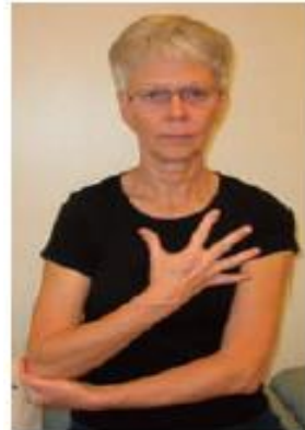
3. Skiftevis knyt og stræk fingrene