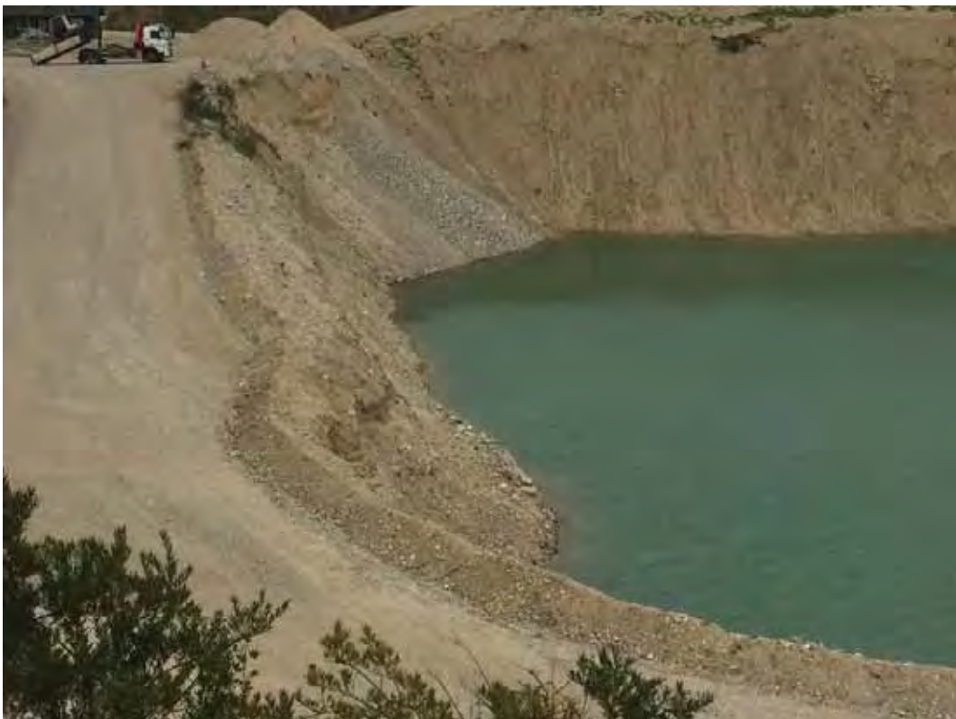
Stejle skråninger ved vejen ned til badestranden i det nordøstlige hjørne af søen