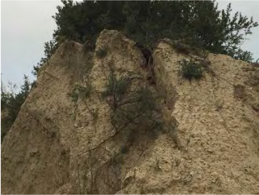
Skråningstop i brud - tæt på stien ved det sydøstlige hjørne af søen.