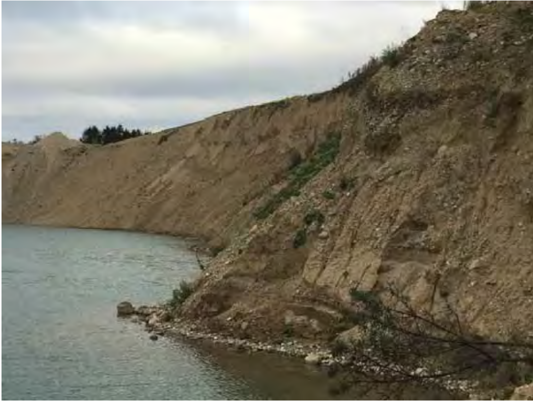
Stejle skrænter i den østlige ende af søen.