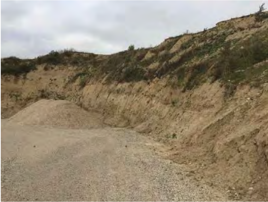
Meget stejl skråning med risiko for nedfald og skred umiddelbart oven for vejen ned til fremtidig badestrand.