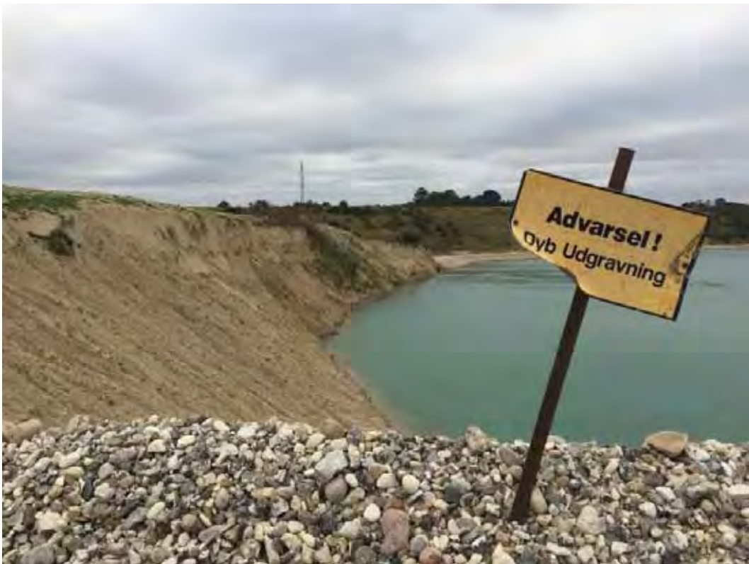
Meget stejle skrænter i den østlige ende af søen.