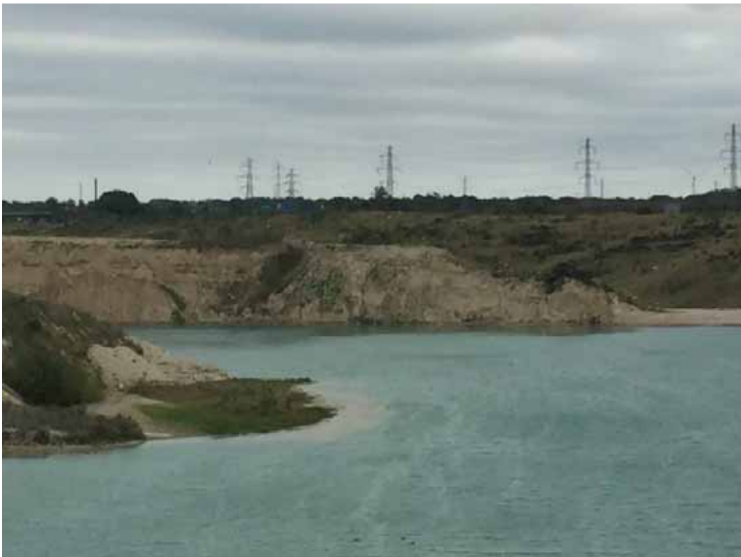
Lille uforstyrret halvø i den nordlige side af søen.