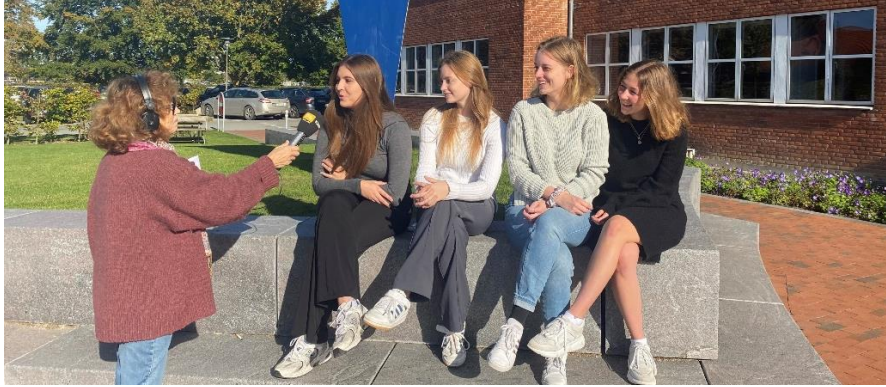
DR P4 interviewer elever fra Næstved Gymnasium, der deltager i et dansk-tysk samarbejde finansieret af Interreg-projektet kultKIT2