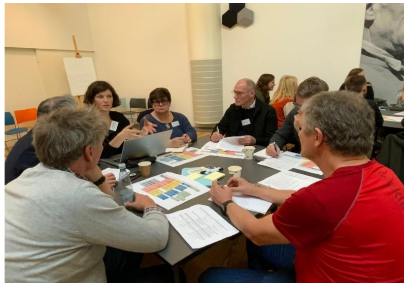
Holmegaard Værk 08. november 2022

Aktiviteterne i modellen er de af Interreg definerede støtteberettigede projektaktiviteter, der kan gennemføres med støtte fra Interreg6As pulje En Attraktiv Region specifikt mål 3.1.