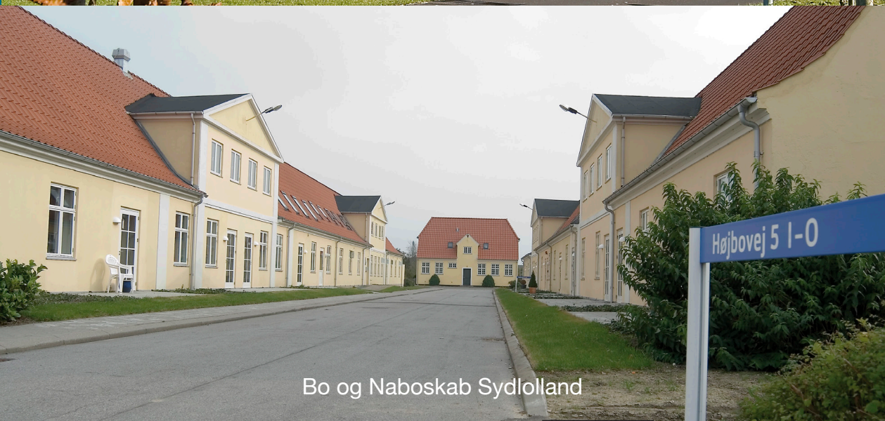
Bo og Nabolik Sydlolland