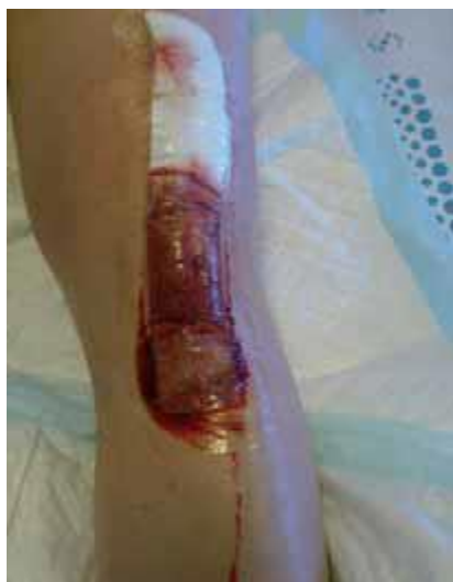
Billede: Utæt og mættet plaster som bør skiftes.

Dit plaster må højst sidde på hoften i 7 dage, inden du skifter det.