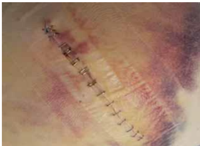
Billede: blodansamlinger på hoften.

Benet og foden kan også blive meget misfarvet, som blå mærker. Dette er en helt almindelig reaktion, og blodansamlingerne fortager sig i løbet af nogle uger.