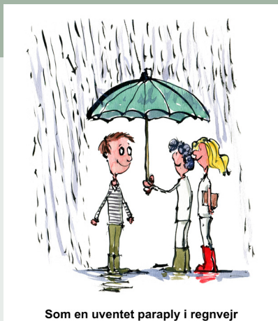
Som en uventet paraply i regnvej