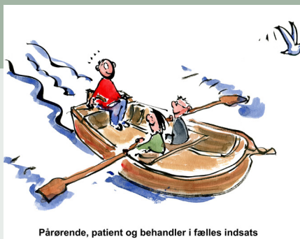
Pårørende, patient og behandler i fælles indsats