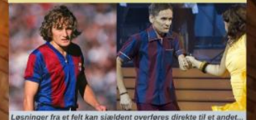
Løsninger fra et felt kan sjældent overføres direkte til et andet...