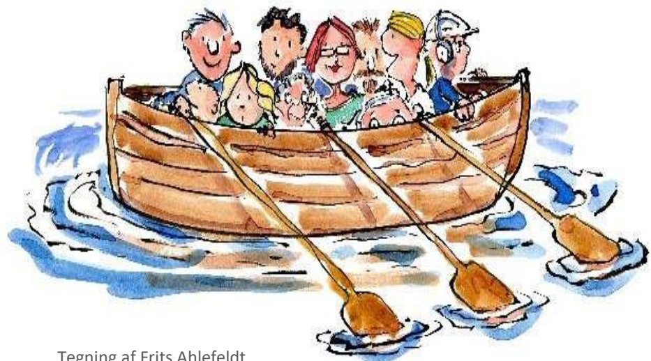
Tegning af Frits Ahlefeldt

Læs mere om pårørende-peersamtaler her: www.psykiatrienregsj.dk/paaroerendeppeer