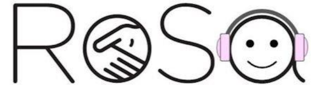
Sine: En dokumentarfilm om livet på et botilbud og vigtigheden af det gode samarbejde