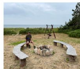
Billede af Onkel Toms hvttte