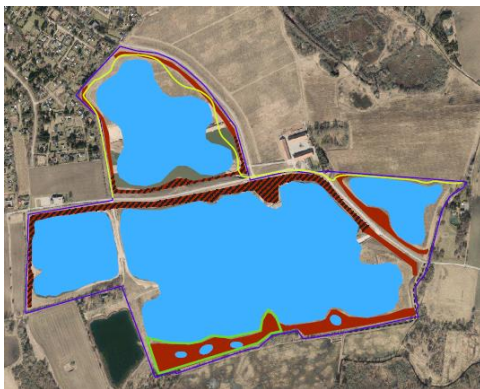
Oversigt oprindelig efterbehandlingsplan