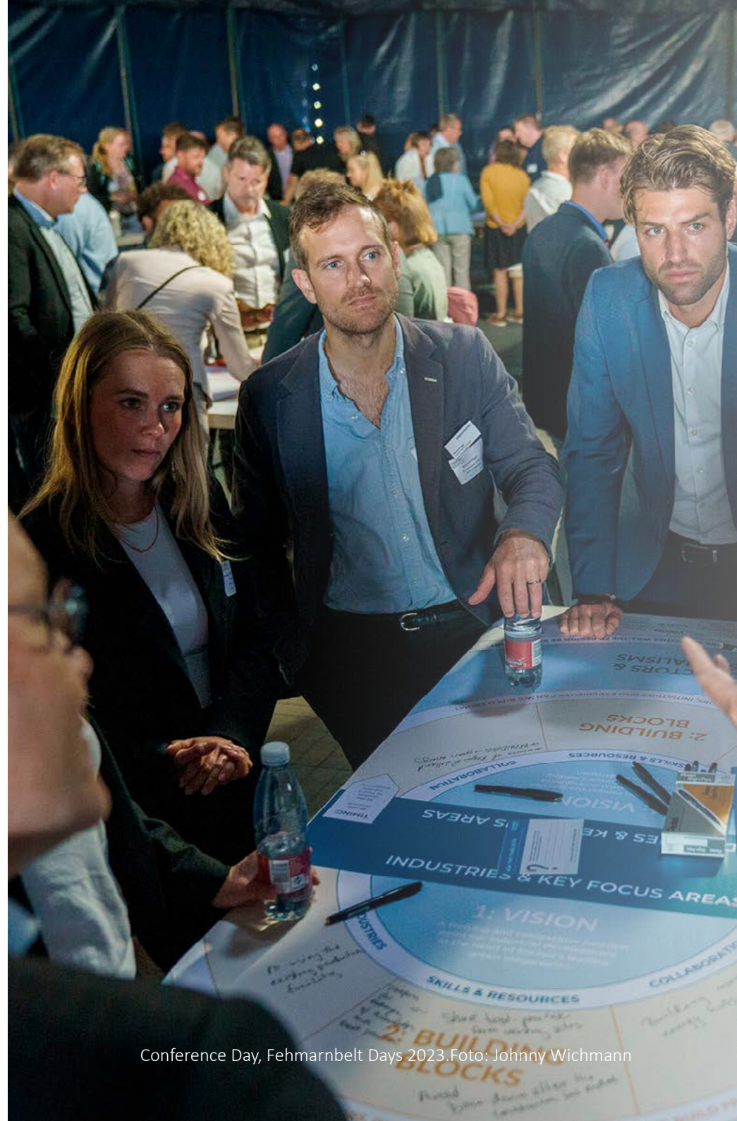
Conference Day, Fehmarnbelt Days 2023.

Ambitionen er at gøre en mærkbar og synlig forskel for borgerne i Region Sjælland. For at lykkes trækker vi på hinandens styrker, lokale kendskab, ressourcer og behov til at udvikle regionen. Det er brug for meget politisk vilje og mod for at skabe den positive udvikling.