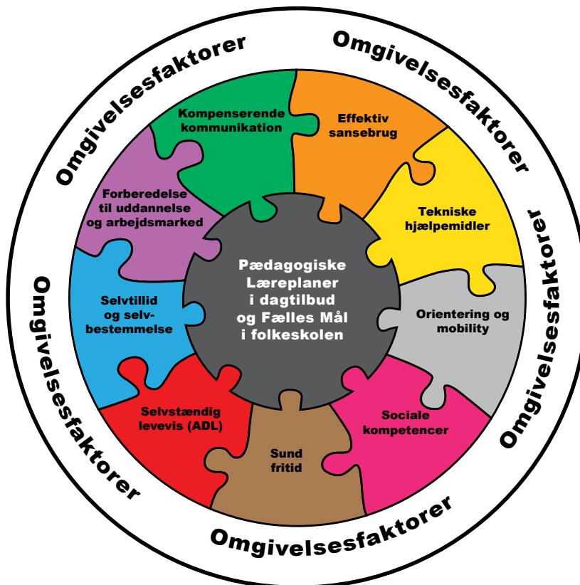
Model De Udvidede Læringsmål

De udvidede læringsmål understøtter deltagelse i og inkludering under de almene mål i dagtilbud og skole, og har fokus på specifikke praktiske kompenserende færdigheder, psykosociale forhold, sansning og motorik m.m.